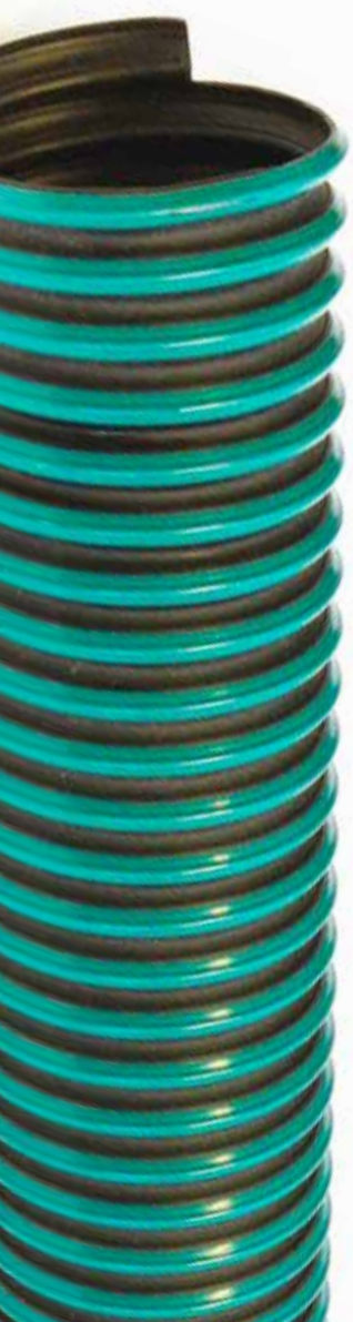
Scheda tecnica / Technical data